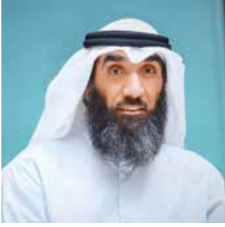
فضيلة الشيخ الدكتور / داود سلمان بن عيسى العضو التنفيذي للهيئة