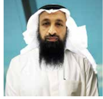
فضيلة الشيخ الدكتور / خالد شجاع العتيبي رئيس الهيئة