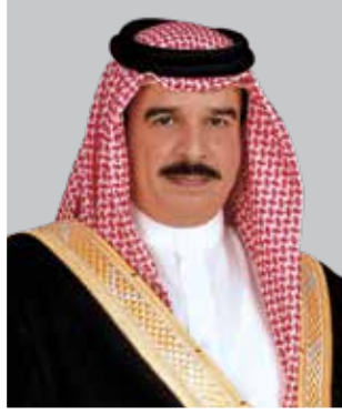
حضرة صاحب الجلالة الملك حمد بن عيسى آل خليفة ملك مملكة البحرين المفدى