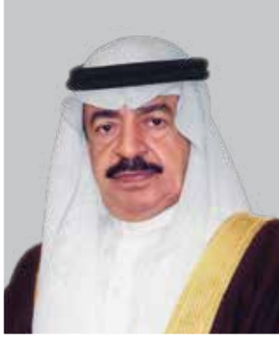
صاحب السمو الملكي الأمير خليفة بن سلمان آل خليفة رئيس الوزراء الموقر لمملكة البحرين