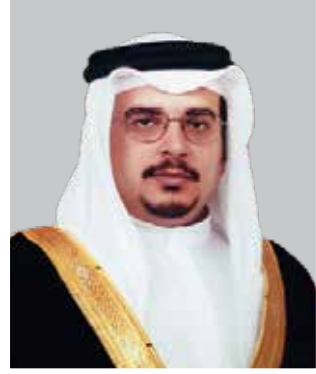
صاحب السمو الملكي الأمير سلمان بن حمد آل خليفة ولي العهد نائب القائد الأعلى النائب الأول لرئيس مجلس الوزراء لمملكة البحرين